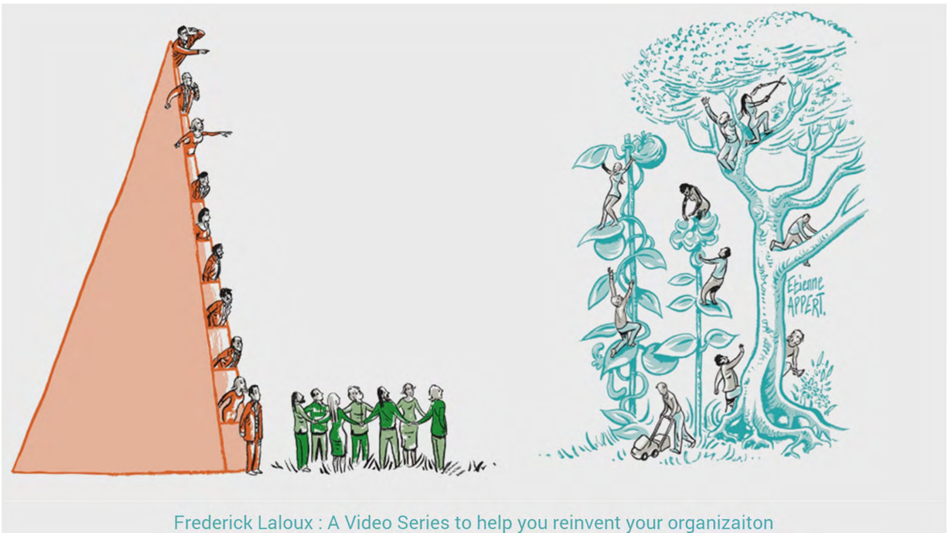
Frederick Laloux : A Video Series to help you reinvent your organization