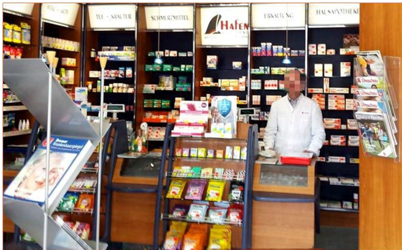
Innenansicht im Jahre 2018 (Apotheker Bild: 03.04.2018, ...)